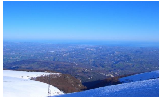
Scorcio di Roccascalegna (CH) e Massiccio della Maiella (CH)