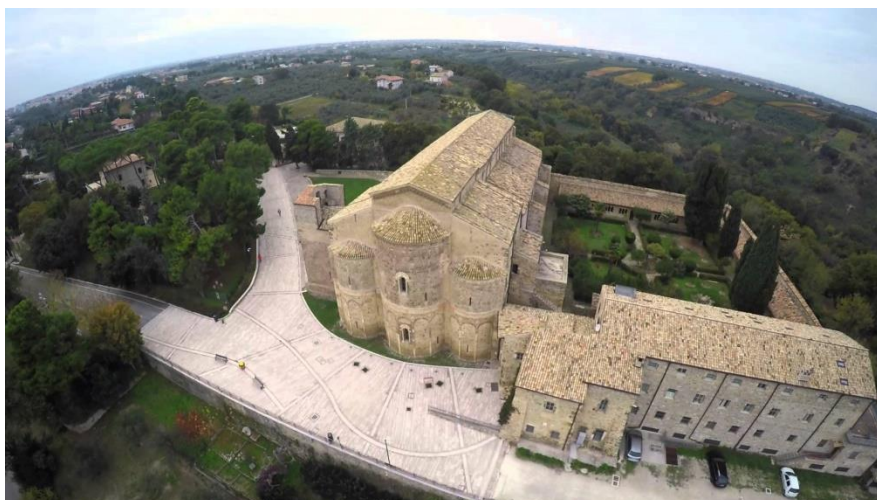
Scorcio dell'abbazia di San Giovanni in Venere (CH)