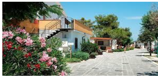
Scorcio del Camping Sun Beach di Torino di Sangro (CH)