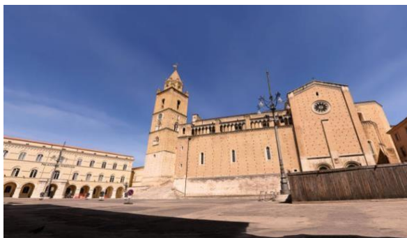
Scorcio della Città di Chieti