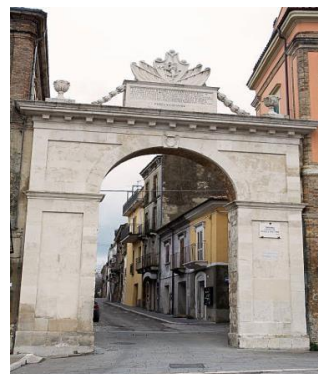
Scorcio della Città di Guardiagrele