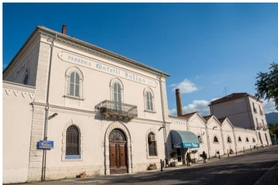
Sulmona, Museo del Confetto Pelino