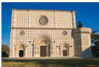
Città di L'Aquila