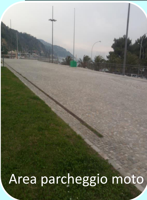
Area parcheggio moto